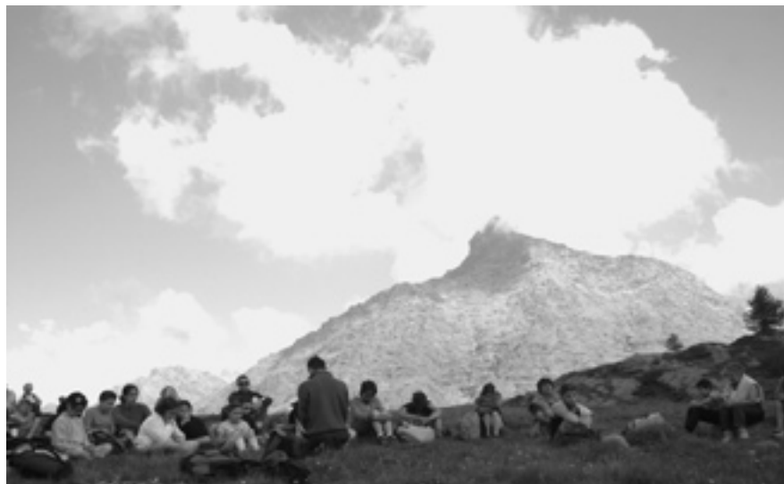
Un momento di catechesi all'aperto

Iniziammo con un percorso forse un po' convenzionale (almeno visto con gli occhi di chi proseguì nel seguire don Pietro nei suoi per-