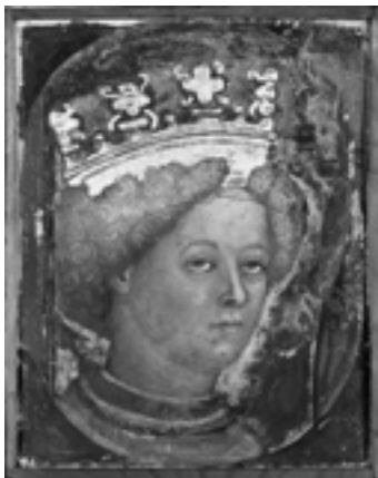
I due frammenti della donazione Jacini

lata “Incoronazione di Agilulfo”) e quello di Autari mancante dalla scena 18 (“Incontro di Teodolinda e Autari presso Verona”) immediatamente sopra la scena precedente.